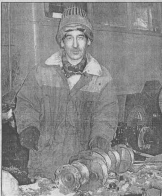
Подлежат ремонту 10 единиц тракторов разных модификаций. Мы остановились воз-