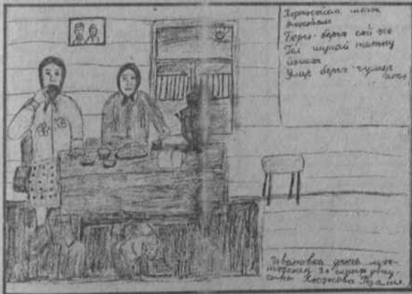
Рис. Хасановой Розалии (с. Ивановка)