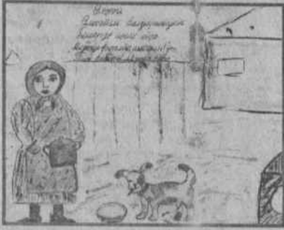
Рис. Шевченко Саши (АСОШ №2)