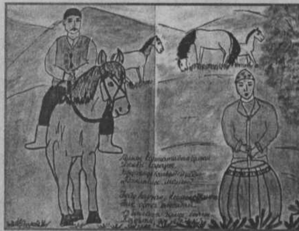
Рис. Байгускаровой Айгузель (д. Галиахмет)