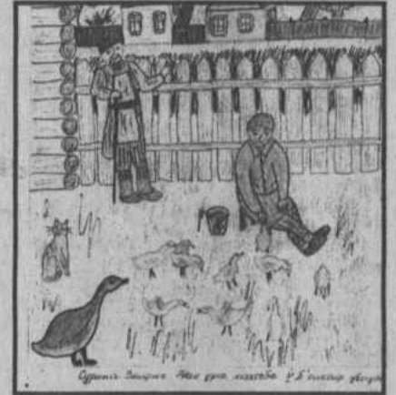
Рис. Суриной Зульфий (с.Абиш)