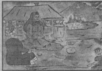
Рис. Акчурина Марата (п.Садовый)