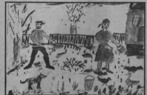
Рис. Султангалеевой Леры (п.Степной)