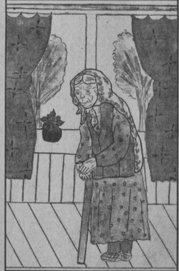
Рис. Суриной Рамзии (с.Абиш)