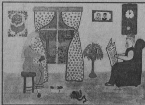
Рис. Рыжовой Ларисы (д.Иляч)