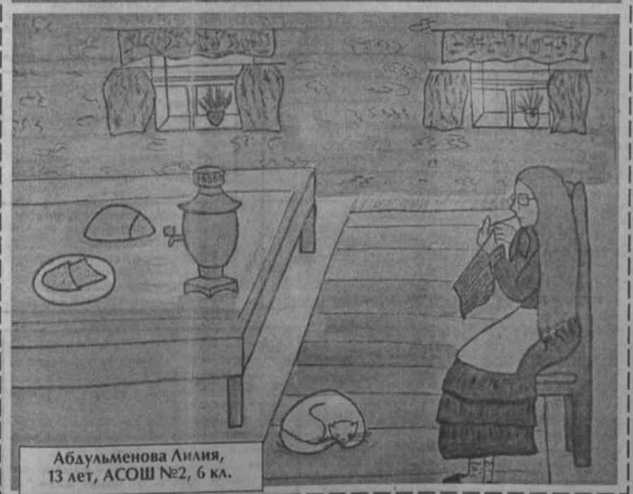
Абдульменова Лилия, 13 лет, АСОШ №2, 6 кл.