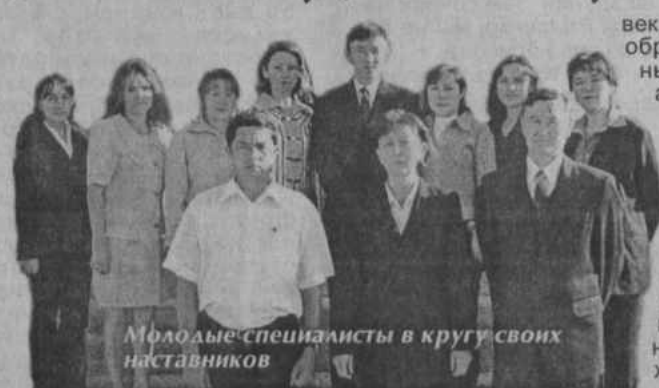
Молодые специалисты в кругу своих наставников

НАДЕЖДЫ о своем будущем район связывает с кропотливым трудом педагогов, повседневно создающих это будущее — поколение, которому предстоит жить в XXI веке. В связи с этим очень важна роль молодых педагогов, которые должны вдохнуть новые идеи в систему районно-