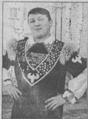
Салавата. Не обошлось

НА КОНКУРС "ХАЙБУЛЛА БЕРКУТТАРЫ" , посвященный 250-летию со дня рождения Салавата Юлаева собрались из населенных пунктов района самые сильные, самые умелые и самые brave парни с целью показать, что действительно они являются потомками Салават батыра. В конкурсах «Знакомство», «Я в роли С. Юлаева» и «Блиц-турнире» ребята показали свои знания, находчивость, оказались знатоками жизненного пути