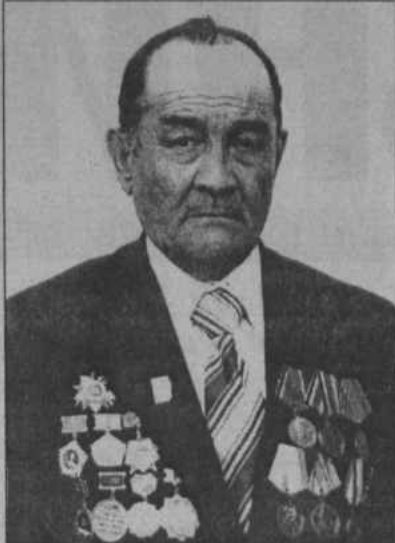
фото из архива