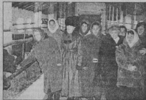
«На фермах хозяйства есть на что посмотреть и что перенять животноводом».

ном передовом сельхозпредприятии в этом году производство молока возросло на 16, мяса — на 12 процентов. Конечно, этого животноводы добились умелым, самоотвер-