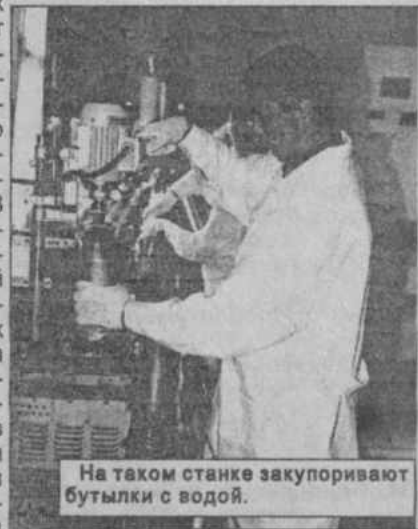
На таком станке закупоривают бутылки с водой.