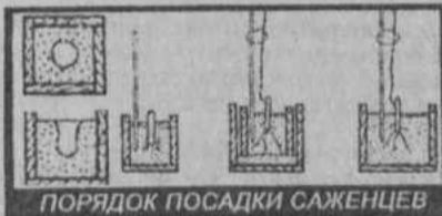
ПОРЯДОК ПОСАДКИ САЖЕНЦЕВ

Выкопайте посадочные ямы (как показано на рисунке). Они должны быть приблизительно таких размеров, чтобы корни сажаемого дерева располагались в них свободно. Например, при посадке яблонь, груш, вишен, черешен и слив на сильнорослых подвоях глубина посадочной ямы не должна превышать 70 см, а для деревьев на карликовых подвоях можно ограничиться глубиной 50 см. Не обязательно делать ямы и слишком широкими. Главное, чтобы в них свободно, без загибания, поместились корни сажаемого дерева. В рытую яму насыпьте холмиком