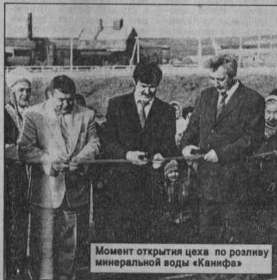
Момент открытия цеха по розливу минеральной воды «Канифа»

10 октября вся общность района торжественно и красочно отметила главный праздник республики — 13-ю годовщину провозглашения Декларации о Государственном суверенитете Республики Башкортостан.