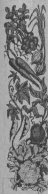
другой стороны приобретает детей к труду, воспитывает