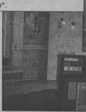
Учащийся 7 класса Арсланов Ильнур. Изобретение: усилитель звуковой частоты универсальный. Можно озвучивать вечера отдыха (то есть первый помощник учителя музыки), орган способен производить 7 мелодий, запоминать, производить запись до 150 нот, воспроизводить звуковые записи с плеера, радиотрансляционной сети, можно использовать как микрофон.