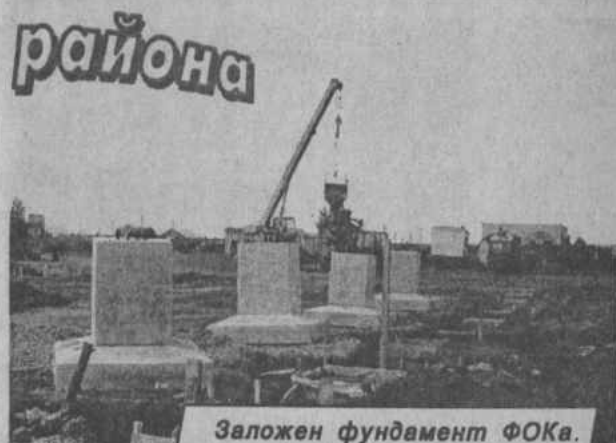
Заложен фундамент ФОКа.

Из других объектов можно назвать строительство автодороги Акъяр-Абиш с асфальтным покрытием Баймакским ДСУ-3. В плане проложить 23 километра: в этом году — асфальт довести до