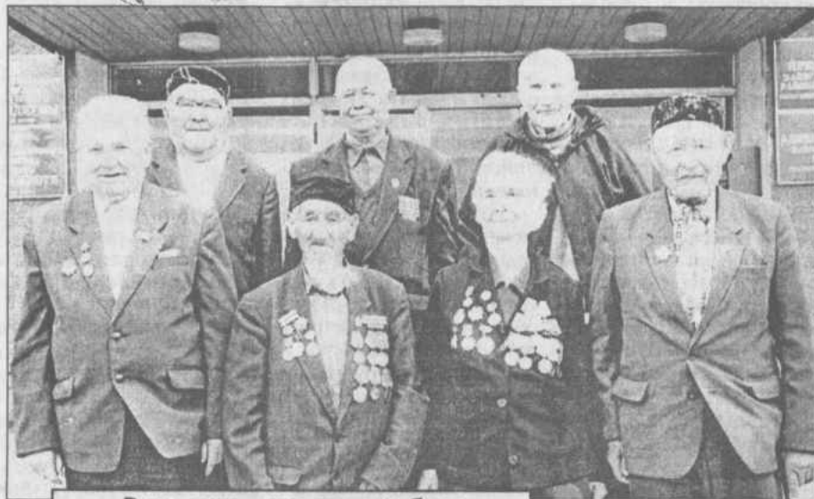
Вот они - участники боев на Курской дуге.

В связи с 60-й годовщиной Победы советских войск в боях на Курской дуге, отмечаем беспримерное мужество и героизм ее участников, и в исполнении Постановления