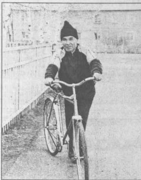
приходилось нам много заниматься физичес-

жет быть тяжело, а мне, велосипедисту с 50-летним стажем (!), это одно удовольствие", — следует ответ. Пока я собиралась духом и мыслями, дальше продолжает он: "В молодости не получилось заниматься определенным видом спорта, сами знаете, какие годы были. В детстве