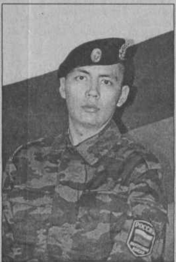
Командир войсковой части.