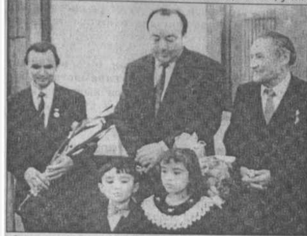
С президентом РБ М.Г.Рахимовым после получения премии имени Салавата Юлаева. Внук и внучка поздравляют своего дедушку со столь знаменательной датой.

Второе из моих воспоминаний об Илячевском периоде детства связано с вступлением в комсомол. Комсомол в те далекие 50-60-е