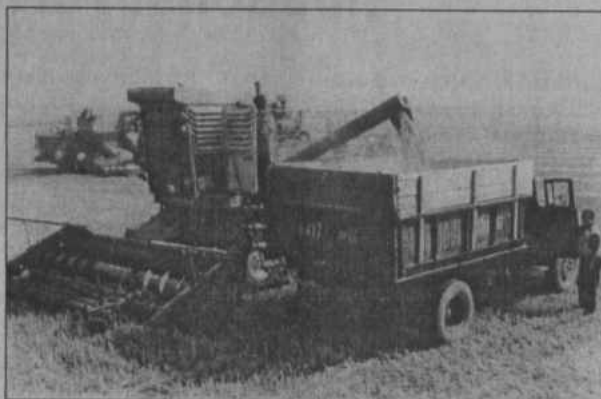
Первые тонны зерна отправляются с поля на ток

"Что вырастили, уберем", так заверяют краснодобровольцы