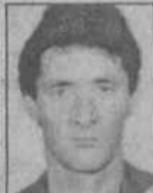
Жена и дочери, с.Акъяр.

Мы помним о тебе, но пусть вспомнят о тебе и родственники и друзья. Спи спокойно, пусть земля будет тебе пухом.