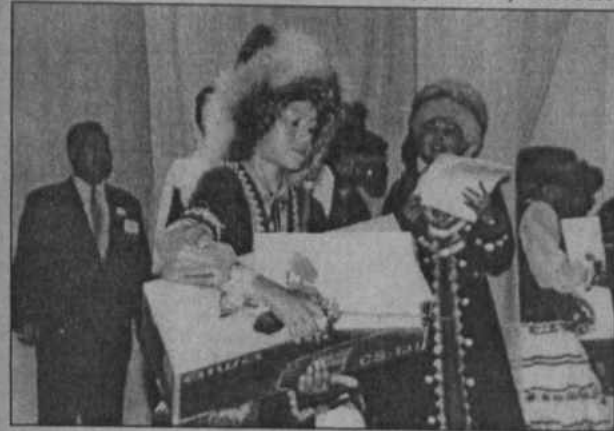
Вручение призов победителям конкурса.

Особенно радует, что много участвовали дети, и по моим наблюдениям, многие