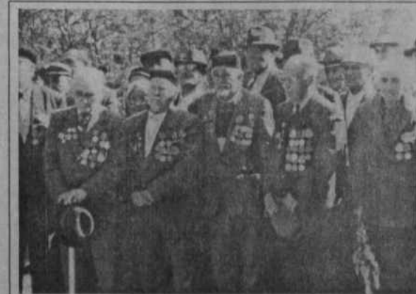
Помним своих боевых фронтовых друзей