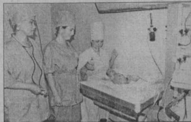
Современное оборудование в родильном отделении позволяет вести квалифицированное медицинское наблюдение за новорожденными