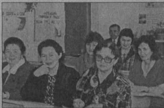
На заседании методического объединения идет обмен мнениями.