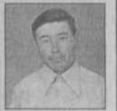
Жена, дети, родственники.