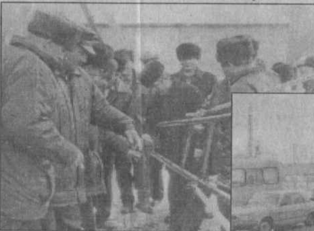
Большой интерес у гостей вызвал опрыскиватель в РТП.

Совсем недавно заработала крупорушка и в колхозе «Красный доброволец», спо-