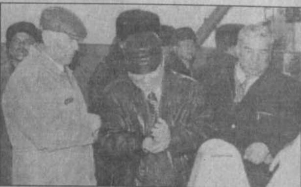
Поправилась маслосбойка в совхозе «Матраевский».

многое взяли себе на заметку. Особенно понравилось посещение совхоза «Матраевский», то что в наше время сохранили поголовье скота, хорошие производственные показатели, прибыльное производство