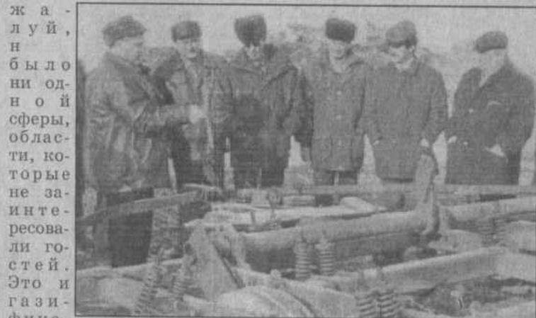
Ремонт техники в совхозе «Бузавлыкский».

ответственных зданий, социальных и культурных учреждений, работа общественных формирований, вопросы реформирования сельского хозяйства, развития производства и переработки сельхозпродукции, хода зимовки общественного скота, учебного процесса в школах и многие другие.