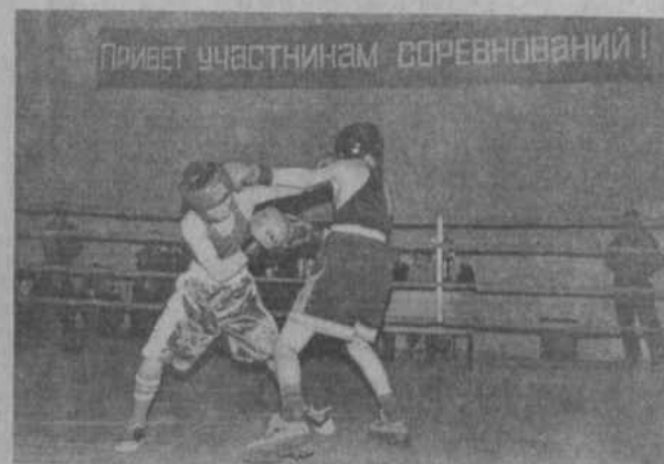
зовые места во время зимних школьных ка-

ских соревнованиях по боксу. В прошлом году три его воспитанника стали чемпионами республики при министерстве народного образования, занимали при-