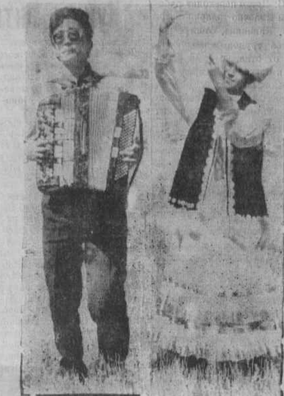
дуг до сердец наших хлеборобов, чтобы как-то облегчить их нелегкий, благородный труд.

Пусть же наши песни, танцы, задушевные мелодии, горячие слова до-