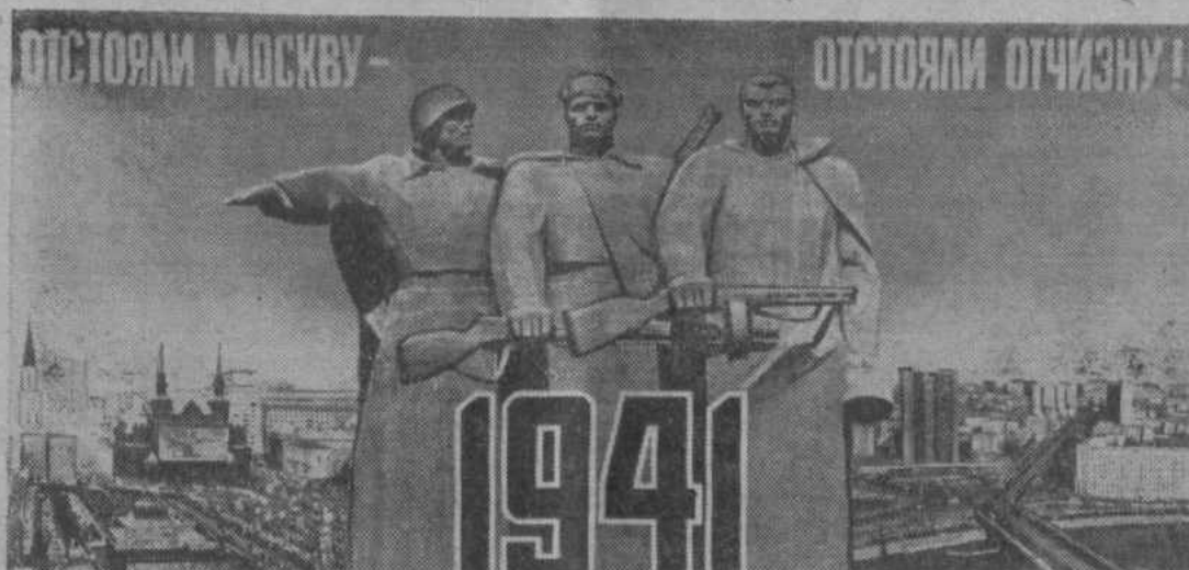
Плакат художника В. Арсенкова. Издательство «Плакат».

Утром 16 ноября 1941 года танковые колонны врага двинулись вдоль Волоколамского шоссе, рассчитывая с ходу ворваться в Москву. Враг встретил стойкое сопротивление советских войск. В этот день на заснеженном подмосковном поле у разъезда Дубосеково 28 совет-