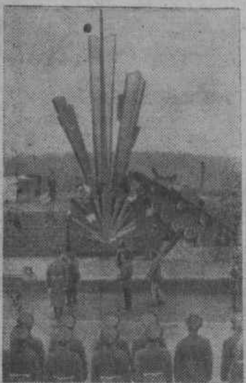
Монумент (автор — архитектор А. Веселовский) представляет собой остова танка, перед которым вздыбился остановленный взрывом вражеский танк.

18 ноября 1941 года, прикрывая отход основных сил полка, они вступили в неравный бой с двадцатью фашистскими танками и батальоном пехоты. Саперы погибли, но враг, равнявшийся к столице, был остановлен.