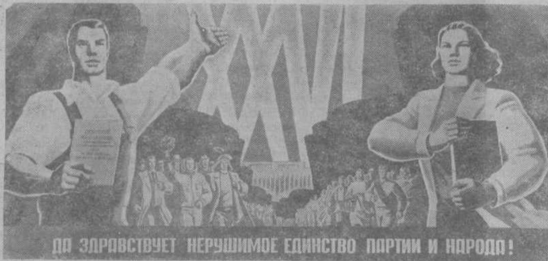
Да здравствует нерушимое единство партии и народа!

Плакат художника З. Смехова «Да здравствует нерушимое единство партии и народа». Издательство «Плакат».