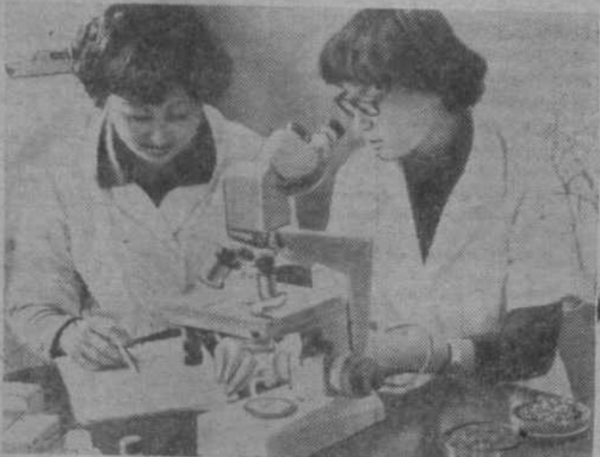
Монголия. Институт природных соединений Академии наук МНР, созданный восемь лет назад, быстро развивающееся и перспективное научное учреждение республики. Одно из ведущих направлений его деятельности — изучение лекарственных растений, применяемых в народной медицине. Учеными получен ряд новых малотоксичных лечебных препаратов, эффективно применяемых при различных заболеваниях.

25 августа — 60 лет назад [1921] основан Монгольский революционный союз молодежи [МРСМ]