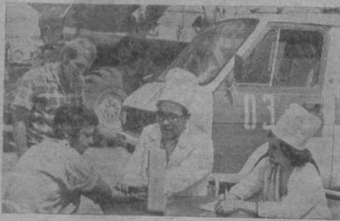
Казахская ССР. В целинном совхозе «Каскеленский» Алма-Атинской области создано семь уборочно-транспортных отрядов, работающих по ипатовскому методу. В каждом отряде имеются звенья по техническому обслуживанию машин, уборке соломы и подготовке почвы под будущий урожай, звенья культурно-бытового и медицинского обслуживания. НА СНИМКЕ: проверка состояния здоровья комбайнера.

26 августа — 61 год со дня образования [1920] Казахской АССР, с 1936 г. — союзная ССР