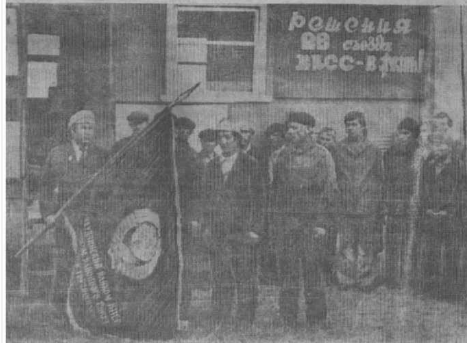
НА СНИМКЕ: момент вручения Красного знамени.

Не работала в тот день уборочная техника и в колхозах имени Ленина, «Красное знамя», имени Салавата. Колхоз «Сакмар» практически к уборке зерновых не приступил. Здесь скошено только 93 гектара, тогда как его сосед, колхоз имени Салавата, уложил в валки на площади 480 и обмолотил 380 гектаров. Очень медленно набирают темпы уборочных работ в совхозе «Степной»: за минувшие сутки здесь скошено 59 и подобрано 159 гектаров.