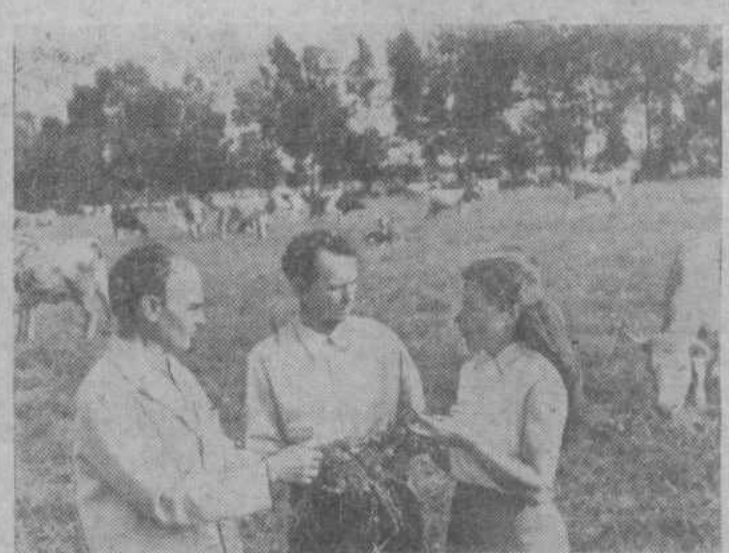
чества травостоя на пастбище.