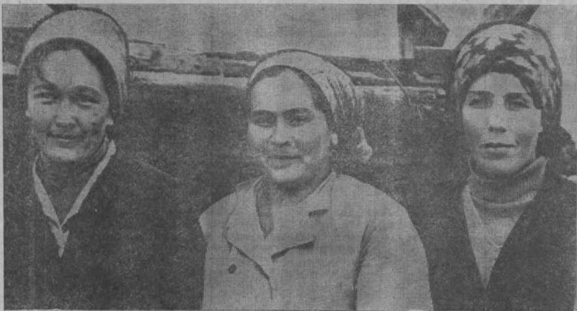
Хороших трудовых успехов добиваются в первом году одиннадцатой пятилетки животноводы Сарыкульской молочнотоварной фермы ордена Ленина Матраевского совхоза. В хозяйстве они прочно удерживают первенство в социалистическом соревновании. Ими досрочно выполнен полугодовой план продажи молока государству. Тон в работе задают передовые доярки, такие,

Повседневная забота о закреплении кадров на ферме, сплочении коллектива, забота об улучшении условий труда и бы-