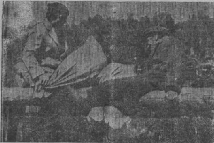
Бой мешками на буме.