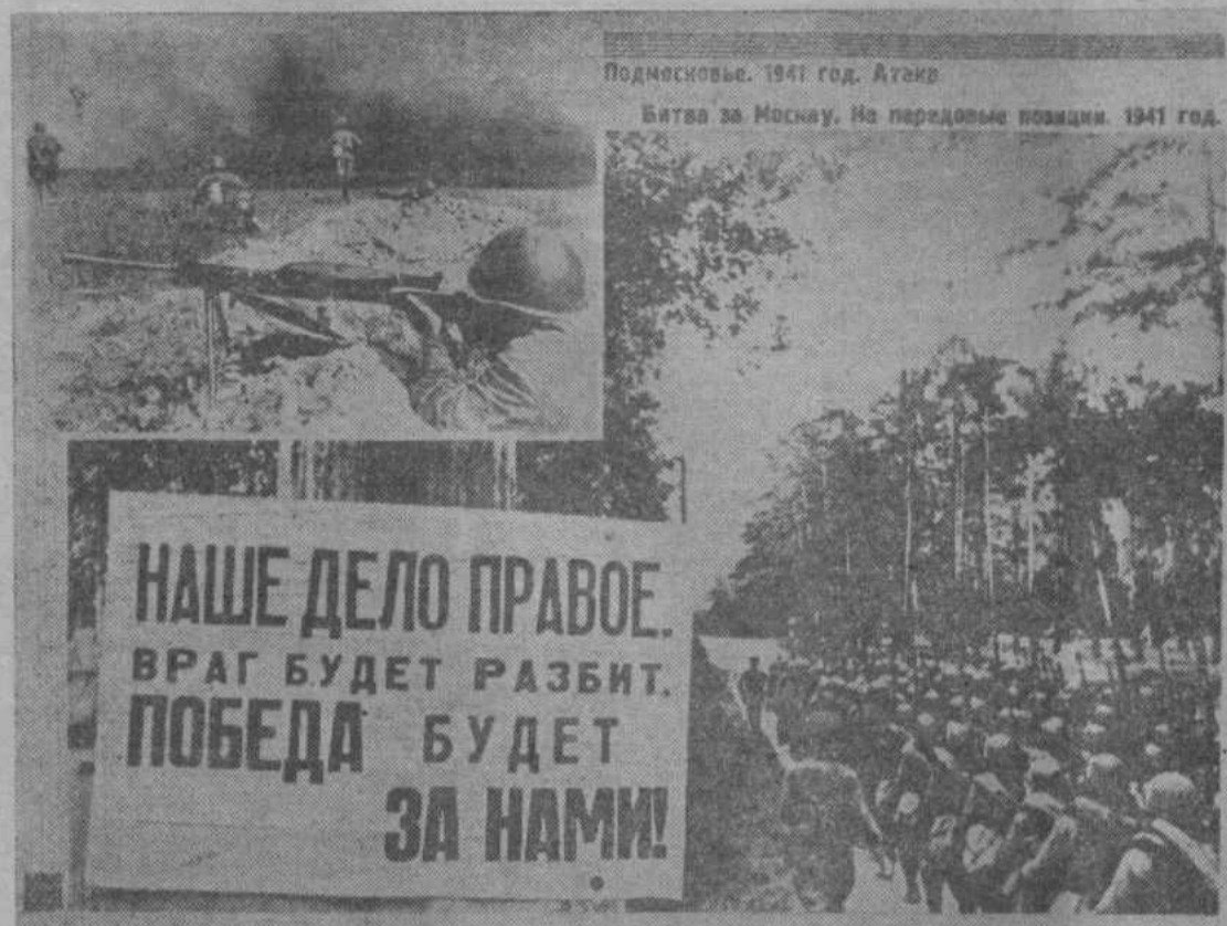
Подмосковье. 1941 год. Атак