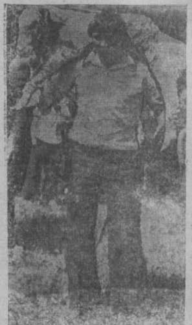
Весомый приз.