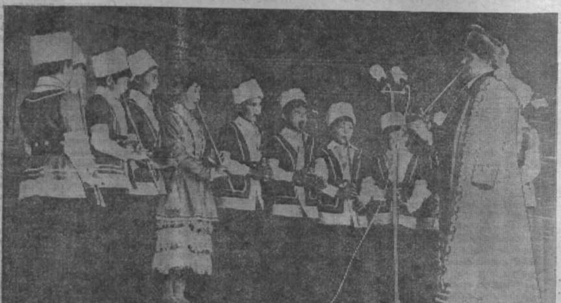
Ансамбль юных куранстов из Абубакирово.