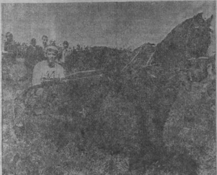
В. Суходолов на рысак «Круг» одержал победу.