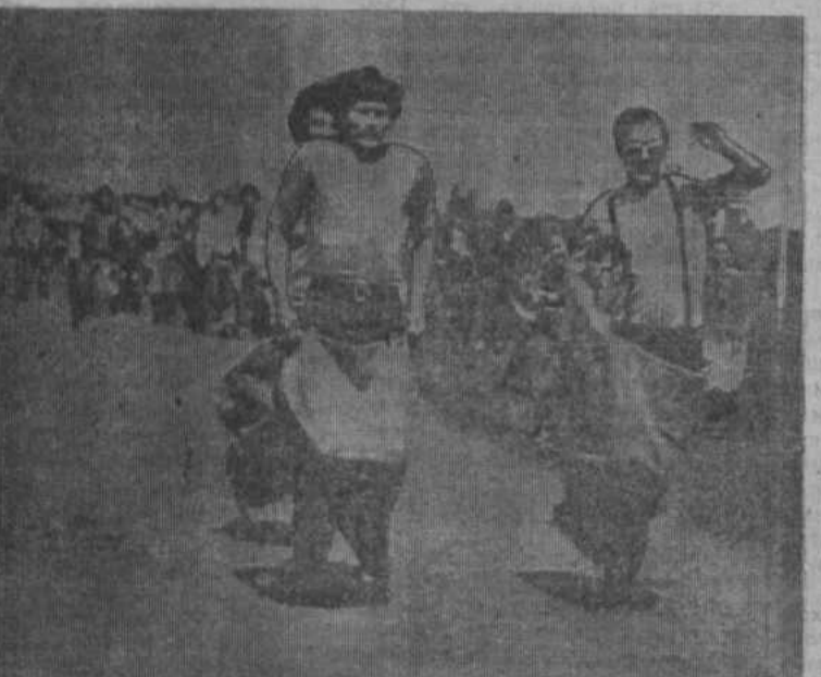
Бег в мешках.