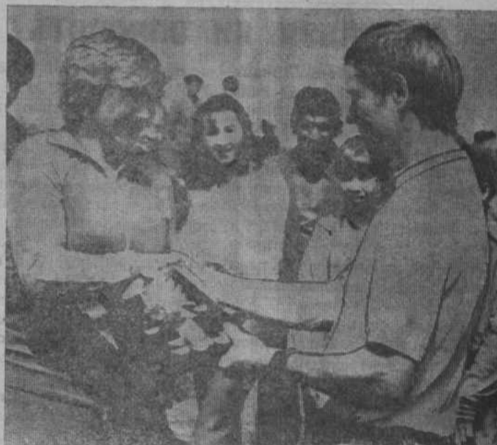
Вручается приз победительнице в беге на 100 метров.