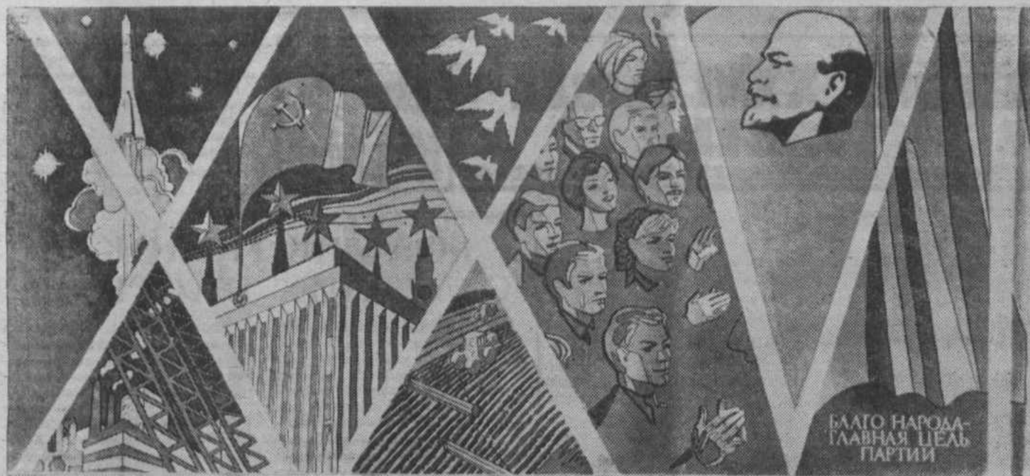
Плакат художника М. Лукьянова. Издательство «Плакат».

ПУЖНО, ТОВАРИЩИ, ПРОЯВИТЬ МАКСИМУМ НАСТОЙЧИВОСТИ, МАКСИМУМ ИНИЦИАТИВЫ И ГИБКОСТИ, ИСПОЛЬЗОВАТЬ ВСЕ РЕЗЕРВЫ И ВОЗМОЖНОСТИ, ЧТОБЫ НЕ ТОЛЬКО ВЫПОЛНИТЬ, НО И СУЩЕСТВЕННО ПЕРЕВЫПОЛНИТЬ НАМЕЧЕННЫЕ ПЛАНЫ