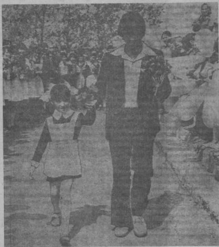
Прозвенел последний звонок... Торжественно он прошел в Акъярской средней школе № 1.

11 часов утра... Учащиеся выстроились перед школой. У каждого букеты живых цветов.