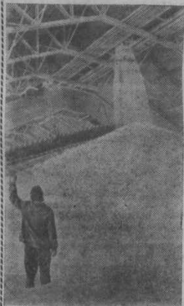
Тулская область. Коллектив Новомосковского производственного объединения «Азот» имени В. И. Ленина с начала