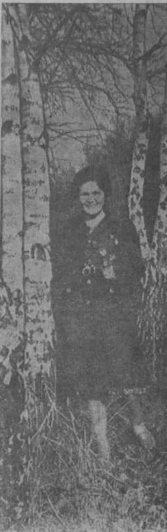
Весенний мотив.