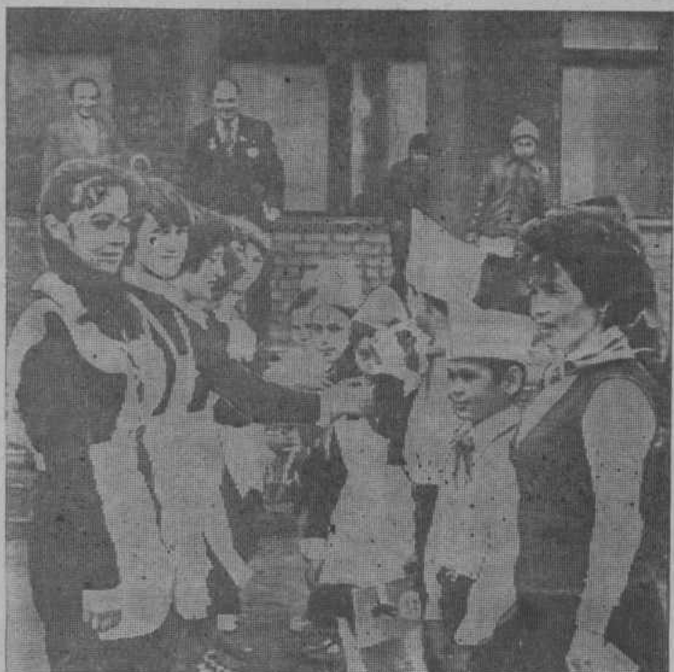
НА СНИМКЕ: старшеклассники повязывают красные галстуки принятым в пионеры.