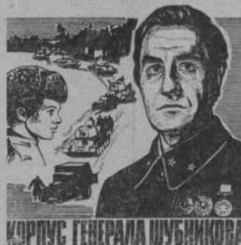
КОРПУС ГЕНЕРАЛА ШУБНИКОВА

Большим разнообразием отличается репертуар новых фильмов. В числе новых советских кинолент, вышедших на экраны по мотивам старинных башкирских сказаний, художественный фильм «Всадник на золотом коне». По сценарию В. Витковича фильм снял старейший кинорежиссер В. Н. Журавлев на киностудии «Мосфильм».