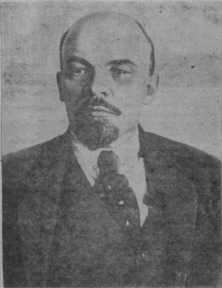
В. И. Ленин. Москва, октябрь 1918 года.