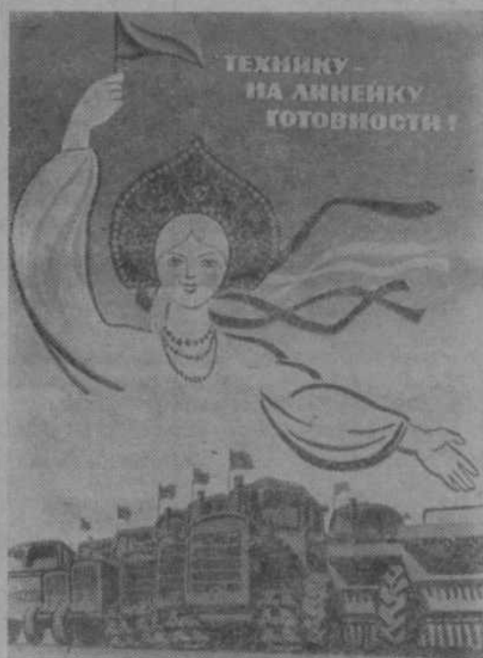
Плакат художника С. Жмуренкова. Издательство «Плакат».