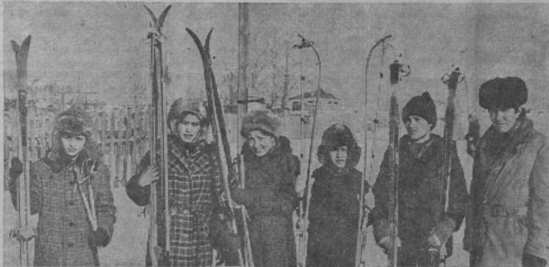
Команда Акъярской средней школы № 2 — чемпион состязаний.