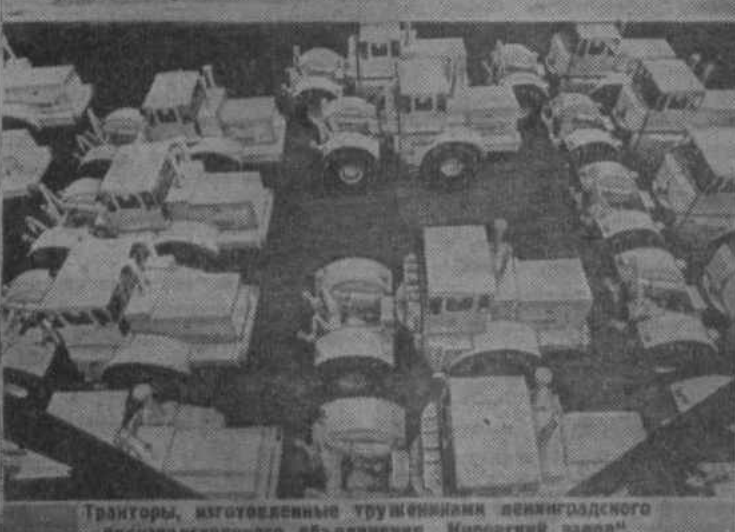
Тракторы, изготовленные труженниками ленинградского производственного объединения «Кировский завод».