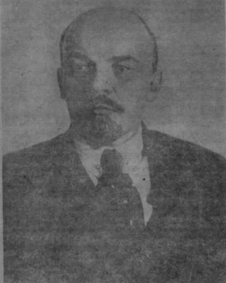
В. И. Ленин. Москва, октябрь, 1918 года.