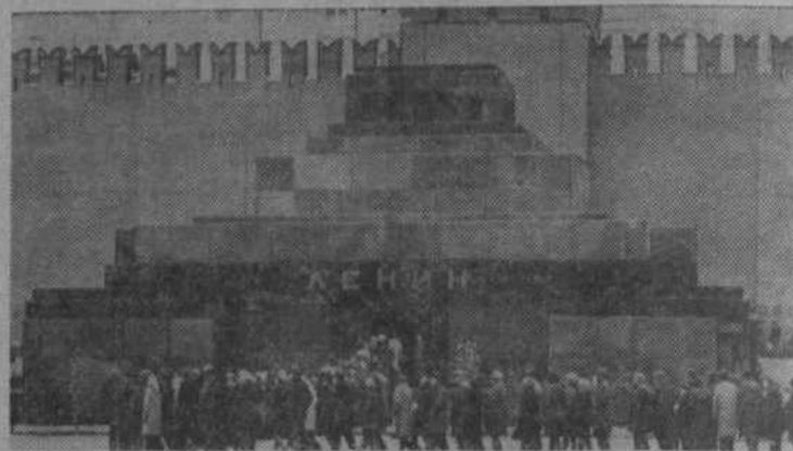
Москва. Красная площадь. У Мавзолея В. И. Ленина.

Прицепной инвентарь должен был быть отремонтирован к 1 января 1981 года. Как и планировалось, эта работа была выполнена вовремя. Иначе обстояло дело с зерноуборочными комбайнами. В четвертом квартале минувшего года не было