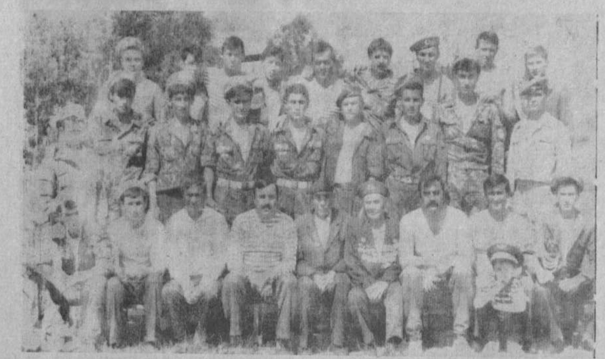
Бывшие десантники — наши земляки.

Наметив конкретный план мероприятий праздника, воины-десантники пригласили всех за «стол». По сути, это и было торжественной частью, на ко-