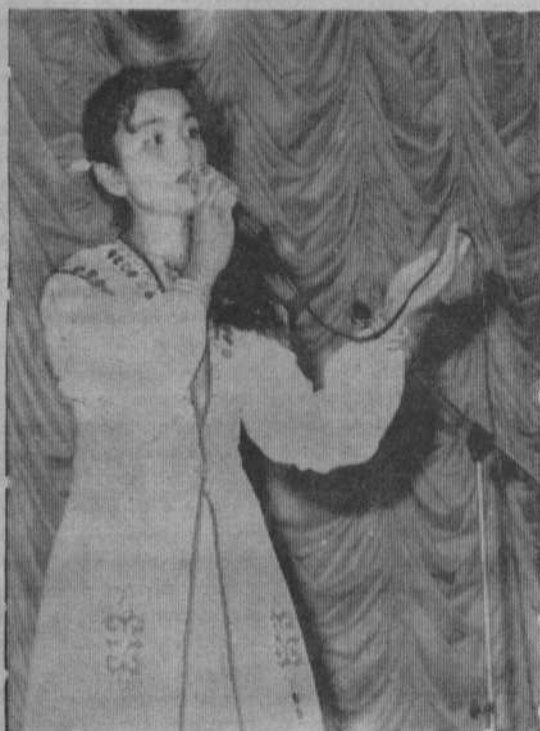
Поет Сария Аскарова.