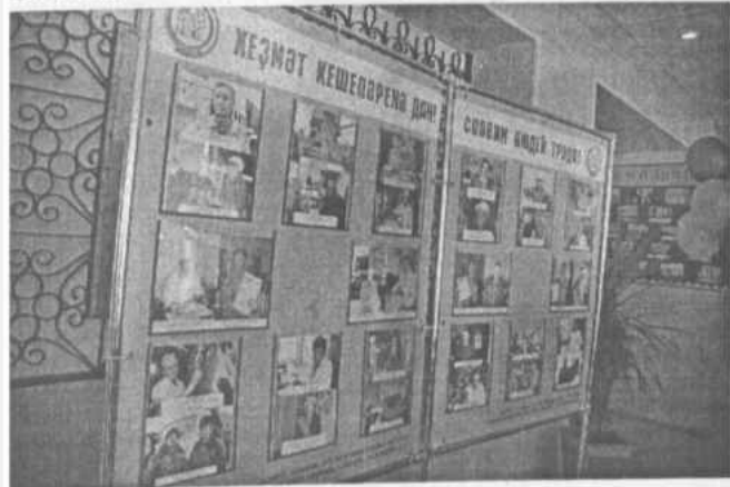
Материалы подготовили Маргия Земскова, Светлана Сахно, Сергей Годубнов, Салават Юлдашбаев, Дия Умергалеева, Альберт Узбеков и Нань Харисов.

Это был большой праздник, который, действительно, стал символом единства и сплоченности всех жителей района и дружбы народов нашей многонациональной республики.