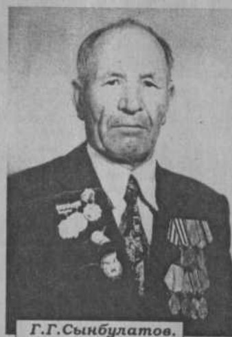
Г.Г. Сынбулатов.

организации. Но для него никогда не была важной занимаемая должность, он просто старался приносить пользу хозяйству, живущим рядом с ним людям, жил ради своей се-