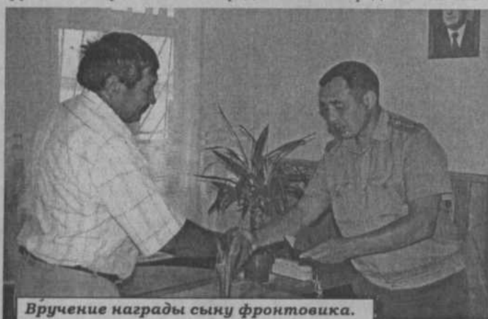
Вручение награды сыну фронтовика.