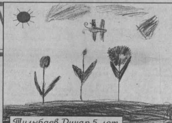
Жулыбаев Динар, 5 лет д/с «Иэйгор».

В каждом рисунке голубое небо и солнышко