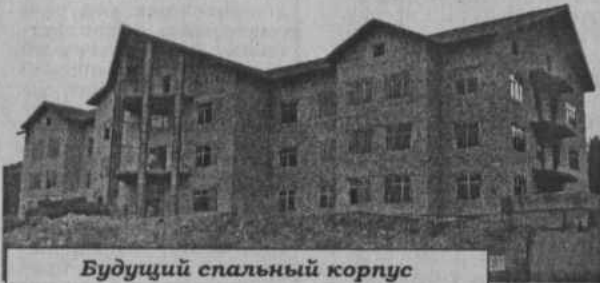
Будущий спальный корпус

трехэтажного спального корпуса республиканского санатория для детей с родителями "Сакмар" в д. Янтышево, рассчитанного на 60 мест, начатое в 2005 году. В проекте заложены стоматологический, массажный, административные кабинеты, фитобар, сауна-бассейн и различные хозяйственные комнаты. На 2-3 этажах двухместные спальные номера с санузлом (душ, раковина).