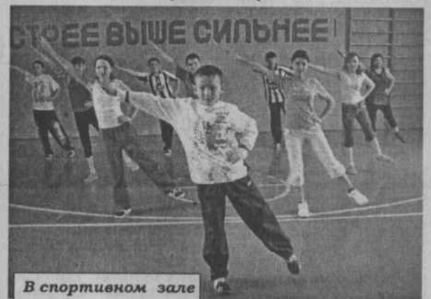
В спортивном зале

В перспективе со сдачей нового корпуса в эксплуатацию коечная