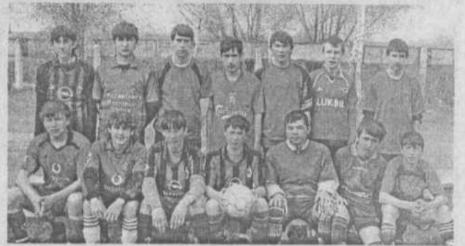
Вот они — чемпионы.

Футболисты МОУ СОШ № 2 с.Акъяр стали первыми на прошедшем финале соревнований по футболу на стадионе «Урожай».