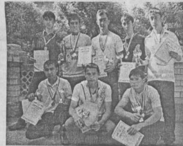
Команда спортсменов-лаптистов района.

В поселке Чесноковка Уфимского района прошли финальные сельские республиканские соревнования по русской лапте среди школьников, которые собрали 24 команды со всех концов нашей республики.