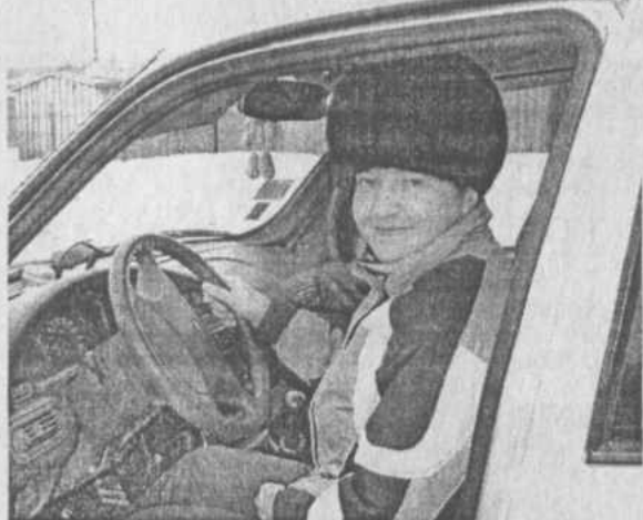
рибаевской средней школы №1, поступила в Магнитогорский техникум советской