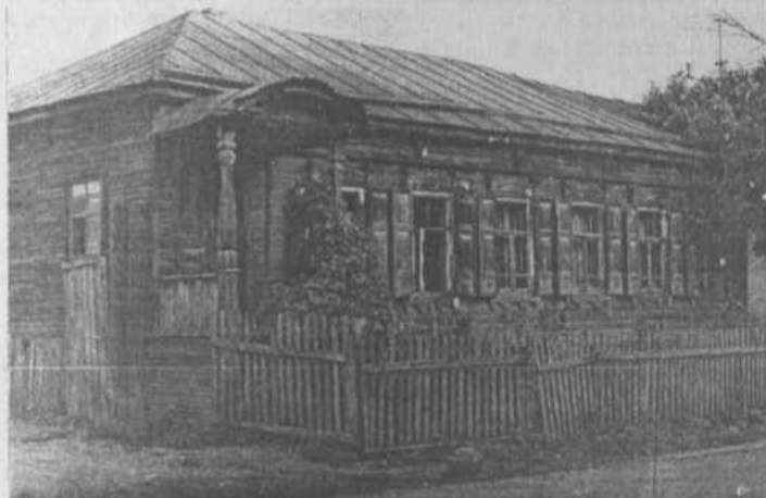
Бывшее здание редакции районной газеты (фото из архива).